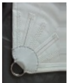
taśmowe mocowanie zwiększające trwałość